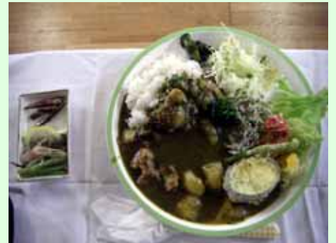
地元野菜たっぷりのカレーです。

白神グリーンカレーは一皿800円で、白神自然学校一ツ森校で提供しています。事前予約が必要です。0173-82-7057までお電話下さい。